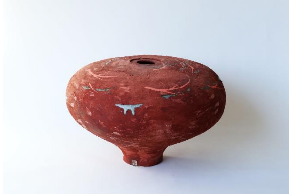
Abbildungen: Objekte von Elisa Stütze-Siegmund für die Ausstellung im Stapflehus in Weil am Rhein.