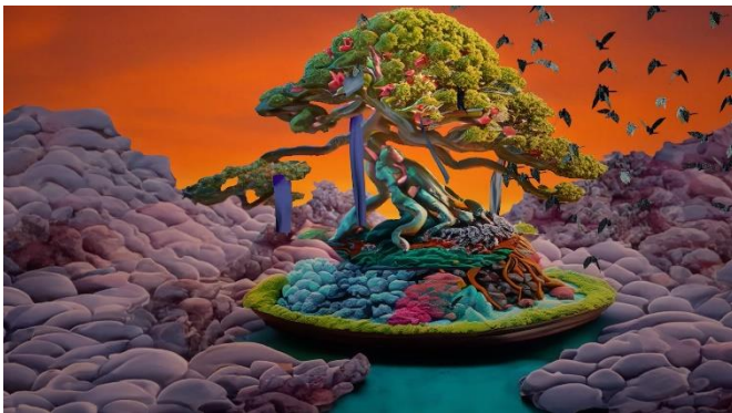
Abbildungen: Videostills von Katrin Niedermeier aus ihrem jüngsten Werk „eye swipe shut – welcome home“, das in der Preisträgerausstellung im Stapflehus in Weil am Rhein zu sehen sein wird.